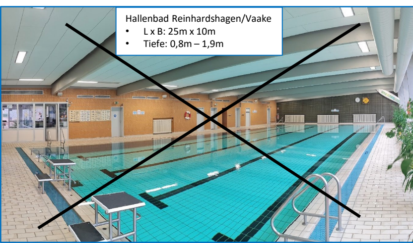
Hallenbad Reinhardshagen/Vaake • L x B: 25m x 10m • Tiefe: 0,8m – 1,9m